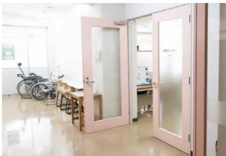
● 北16 桑キャンパス

強いストレス状態の中を生き残れる人の性格特徴として、「子供らしくあること、しかし子供っぽくないこと（Being child-like but not childish）」を挙げる心理学者がいます。幸せそうな子供は、遊びのための無目的の遊び好き、時間も周りの出来事も、自分の全ての心配事も忘れ、口笛を吹いたり、鼻歌を唄ったり、独りごとを言ったりします。もしあなたがなにかに思い悩み、行きどまったときは、いったん肩の力を抜いてみましょう。子供のような無邪気な好奇心を持って、固定概念を持たず、間違いをすること、自分自身を笑うことにためらわず、自分に対する批判に心を開いて受容すれば、少し心に余裕を持てるようになるはずです。